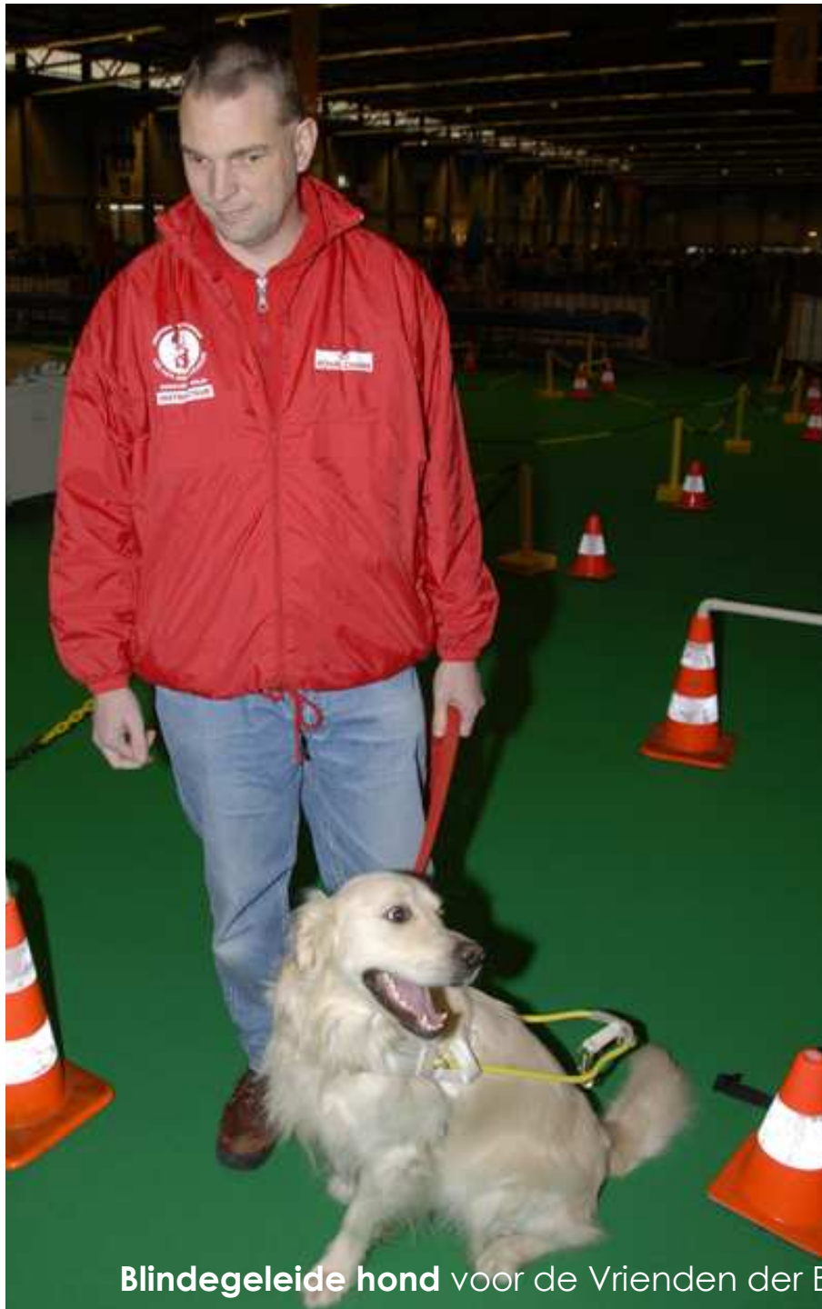
Blindegeleide hond voor de Vrienden der Blinden te Koksijde €10.000 (2007-2008)

Mail Van de: "Vrienden Der Blinden - Koksijde"