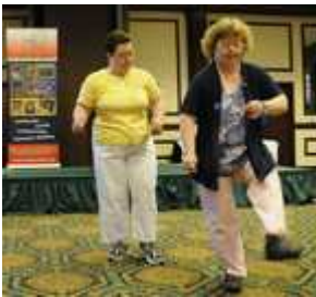
Deelnemers aan de talentenshow tonen hun dansstapjes.

Australië. Deze Kiwanis-bus vervoert ouderen, mensen met een beperking en andere groepen voor uitstapjes in het gebied rond Adelaide.