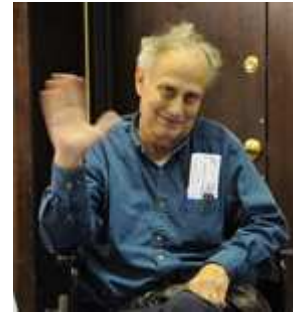
Een lid van Aktion Club komt aan voor de sluitingsbijeenkomst.