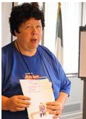
Een lid van Aktion Club beschrijft haar tekening in een workshop over posters.