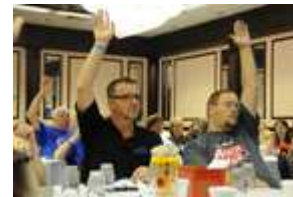
Leden van Kiwanis en Aktion Club werken samen op een activiteit van de sluitingsbijeenkomst.

U vindt meer conferentiefoto's op de Aktion Club Flickr-website .