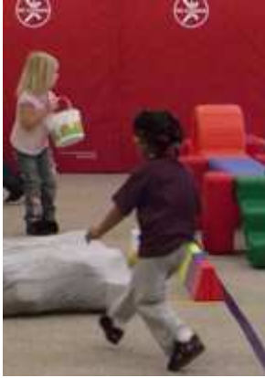
Kinderen zoeken eieren en andere "schatten".

programma voor jonge kinderen uit gezinnen met lage inkomens.