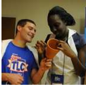
Leden van Aktion Club en CKI werken samen aan een service-activiteit van het Eliminate-project.